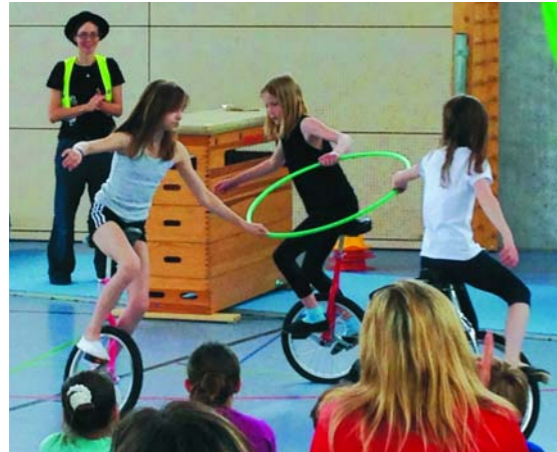
Zirkus – Auf, in die Manege! Grundschule Mittelstadt Reutlingen 2. bis 4. Klasse

Die Schüler übten sich als Seilläufer, Jongleure, Einradfahrer, Trapezkünstler. Auch Clownerie und Theater waren sehr beliebt. Erste Ideen der Kinder für kleine Nummern wurden gemeinsam zusammengefügt, Musik und Kostüme gefunden.