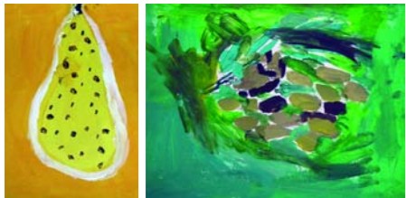
KuSCH – der Kunstzirkel