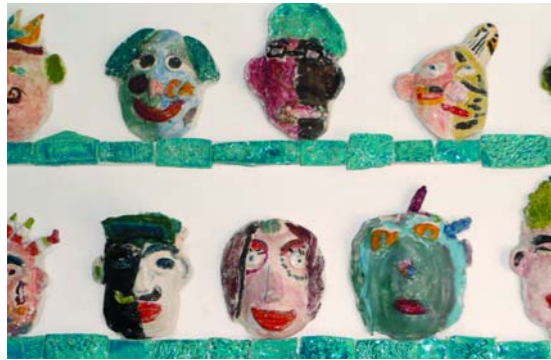
Zwei Beispiele Keramikwandgestaltung mit Portraitreiefs Weinbrenner-Grundschule Karlsruhe, 3. Klasse

Die Klasse bestand aus einer sehr lebendigen Mischung von Kindern unterschiedlichster nationaler Herkunftsländern: Kinder aus Deutschland, Syrien, der Türkei, Äthiopien, Ägypten, Polen, Russland, Spanien, Italien, Kroatien. Im Dialog mit den Kindern entstand die Idee, über Identität nachzudenken.